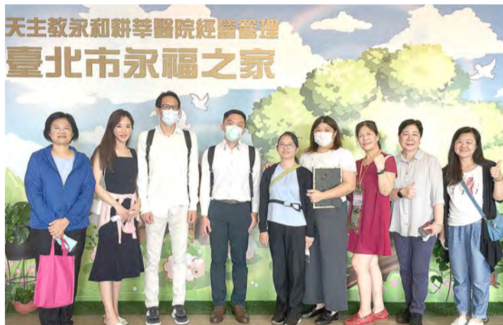
▲九月九，彼此互勉：願為孩子們建立永遠幸福家庭（永福之家）的付出，長長久久！

腿排、粽子、粉蒸肉、東坡肉等每月一道愛心發想的食物因而產生；食物製作從食材的選擇到烹飪、打成流餐、加熱後加入食物增稠劑、重新塑形成軟食，更要求兼顧食品的色、香、味感，大大提高院生用餐的意願，努力自己進食。看著孩子們吃到成形食物的開心笑臉，同仁辛苦投入都是值得，激勵團隊努力研發更吸引孩子進食的菜單。