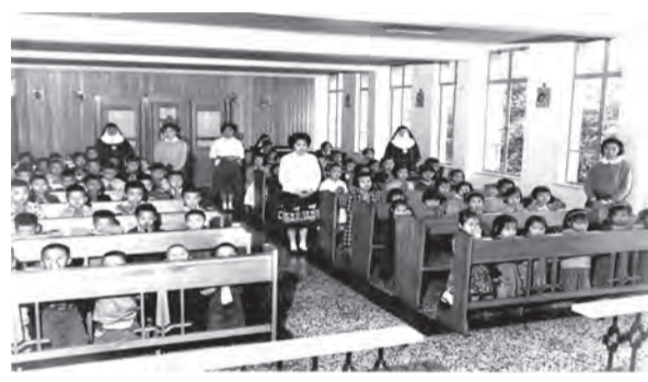
▲早期聖家堂借用會院開辦兒童主日學，信仰向下扎根。

在教友學生的牧靈關懷上，成立了「聖言基督生活團」，除了住生外，亦有其他大專教友參加，深入依納爵靈修，關懷社會，每年的聖誕節為樂生療養院的病人義演募款，培養了團員們休戚與共的精神。早期亦提供場地給台北教