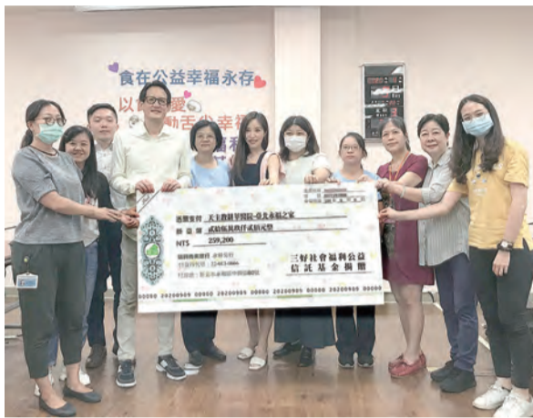
▲感謝三好社會福利公益信託基金愛心捐款

因此，開始了「以食傳愛——舞動舌尖幸福」計畫，邀請專家及食材廠商來永福教導同仁，由主任、營養師、職能治療師、及教保員親自披掛上陣，研究學習如何把食材軟化劑融入各式各樣料理，提供吞嚥困難院生每月一次享用軟食食物。從今年1月到8月，收集院生的喜好，如：豬排、湯圓、廣式叉燒肉、照燒雞