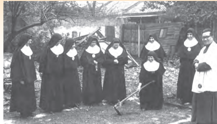
▲1954年，青田街會院動土典禮。