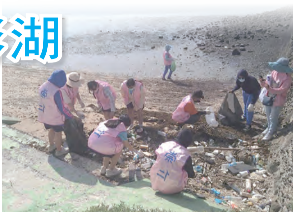
▲寶特瓶、瓶蓋、漁網浮球、浮標等是常見的海洋漂流物。