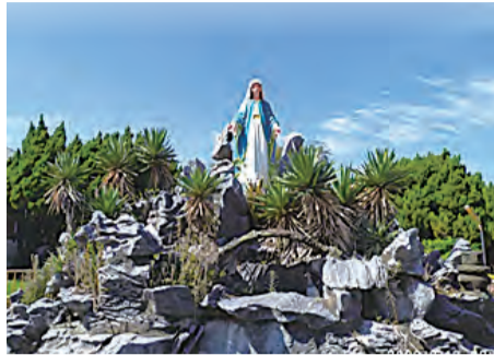
▲座立於寧園安養院正門，池塘中央的無染原罪聖母態像，常有住民及同仁駐足祈禱。

陳神父講道時，首先感謝並慰問現場同仁們的辛勞，再引述不同宗教及典故說明平安祈福禮，除有追思亡者、為亡者祈禱的意義外，更重要的是提醒在世的人「悔改」。陳神父勸勉不需懼怕鬼神，因為我們有比鬼神更強大的天主在保佑，因此，當軟弱犯錯時，不要害怕逃避，應誠心向天主懺改，慈愛的天父必會寬恕我們的過錯，並在天堂為我們預留位