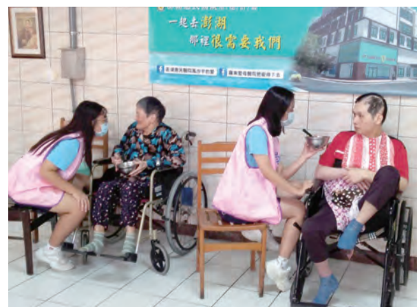
▲在護理之家，協助長者進食，陪伴長者。

然而，社會上還是有許多人因為不了解而污名化這些孩子們。未來，如有機會，我樂意讓更多的人認識及了解，甚至是幫忙他們。