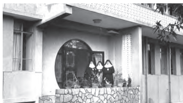
▲早期的會院，修女們在此展開福傳與牧靈工作。

在她迫切渴望並在強大信德的帶領下，耶穌孝女會修女們從未停止向外福傳的腳步，1931年抵達中國，1953年被迫撤離上海，輾轉