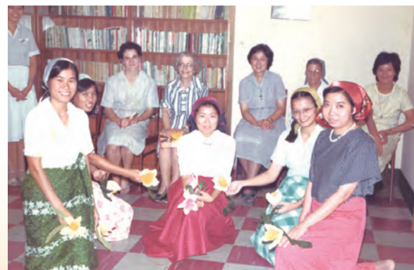
▲欣逢修會的慶節，姊妹們跳舞同歡，喜樂共融。

再一次深深地感謝所有與我們分享生命的朋友，以及所有幫助我們的恩人們。我們無法一點名道謝，但在我們的祈禱中深深祝福。3年後，我們在新的青田會院再見！