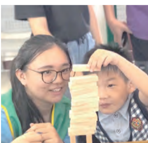
▲與孩子玩疊疊樂遊戲 ▶協助長者進行遊戲