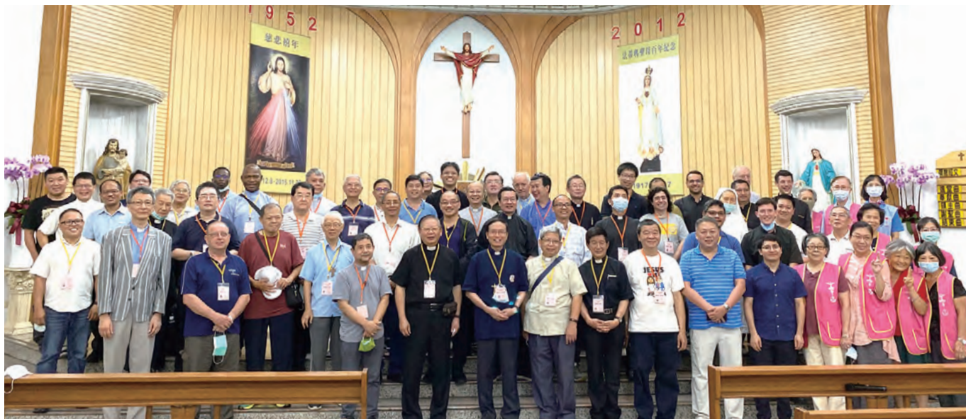
▲台北總教區司鐸團和桃園聖母聖心堂的神父及教友們歡喜合影