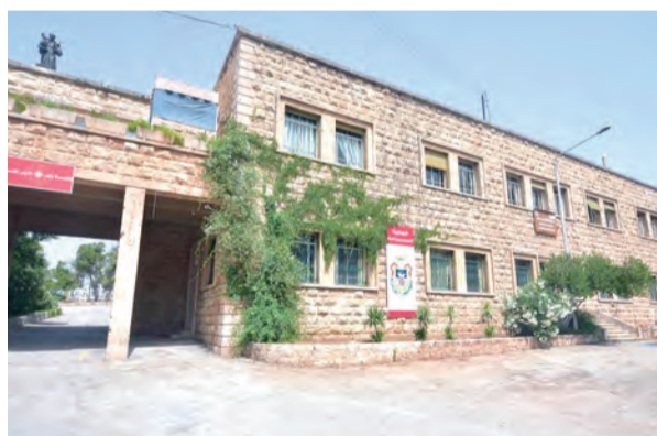
▲著名的阿勒頗聖地公學

當地的基督徒與穆斯林的對話不是憑著理論來進行，彼此少有正式的對話。但雙方每天一起生活，面對同樣的挑戰和困難，迫使彼此的友誼和工作往來都成了對話關係，沒有這些關係，無法在當地生活。在當地，基督徒以對他人的開放而為人所熟知，因此，他