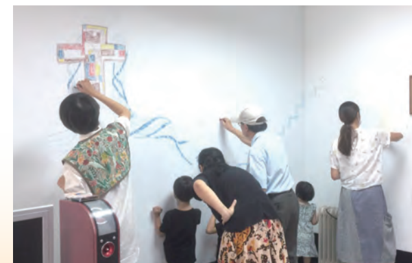
▲最後的聚會，教友們在會院的牆上畫下對這裡的情感。