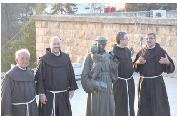
▲阿勒頗的方濟會士們在戰爭及疫情中，持續展開服務的使命。

退，人們對未來有些絕望，促使人們不得不離鄉背井以尋求更好的生活。惟耶穌基督透過愛德工作和對話繼續活躍地臨在，雖然方濟會是一個少數人的團體，但投入且活躍，憑著信德的眼光，引領人們以不同的角度，在痛苦中找到意義。