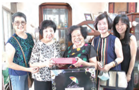
▲崇她社來訪，令獨居長輩十分欣喜。

每逢中秋佳節，正值闔家團圓時刻，社會上仍有許多長輩因家人無法相伴左右，獨自一人生活。聖馬爾定醫院社區醫療部長期關懷獨居老人，中秋節前夕，特別與國際崇她嘉義社一同拜訪獨居長輩們，除致贈祝賀禮品、陪伴話家常的同時，也將這份溫暖傳達給長輩們，使他們感受到關愛之情。