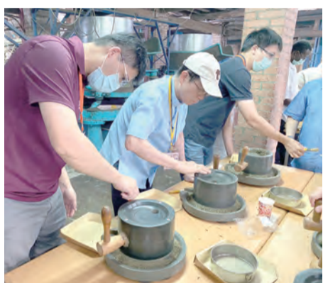
▲認識地區文化特色，體驗磨茶粉樂趣。

台北總教區一年一度的司鐸共融活動於9月9日，在鍾安住總主教的行前祈禱中揭開序幕：「我們是一個共融的團體，藉此機會彼此認識、交換福傳經驗、增進司鐸弟兄間的情誼；祈求聖母瑪利亞的轉禱，感謝天主賞賜我們司鐸聖召，跟隨主耶穌，一起在台北總教區服務，這也是特別的恩賜；懇求天主降福此次行程一切平安順利。」