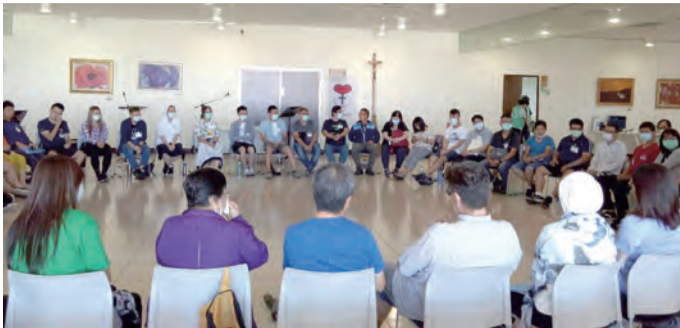
▲在聖神的帶領下，越過了九重山，共同經歷深刻的成長，與天主更親近。