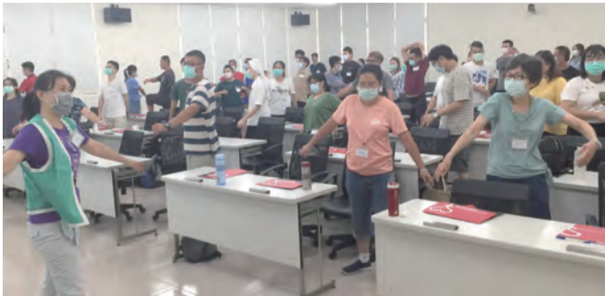
▲CHOICE團員互動熱絡，敞開心，共融在主愛內。