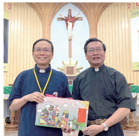
▲鍾安住總主教（左）贈送張文福神父由育仁啟能中心慢飛天使手工製作的中秋禮盒