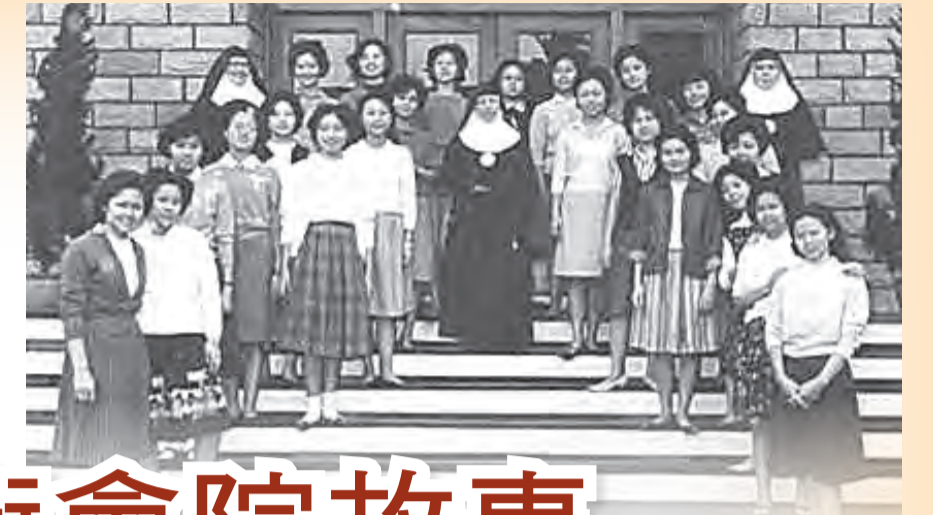
▲明德女生宿舍住生與修女們合影