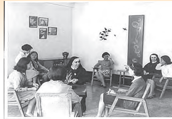
▲明德女生宿舍生活成為堅固信仰並孕育聖召的園地。