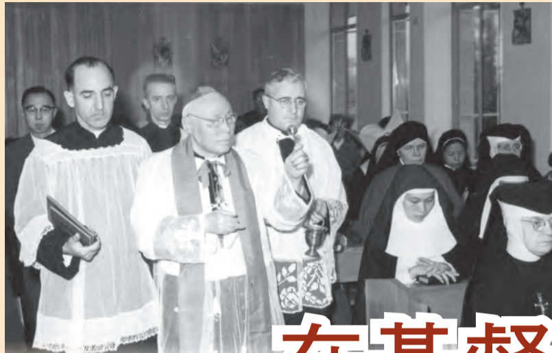
▲1963年12月7日會院落成，由田耕莘樞機主教祝聖。