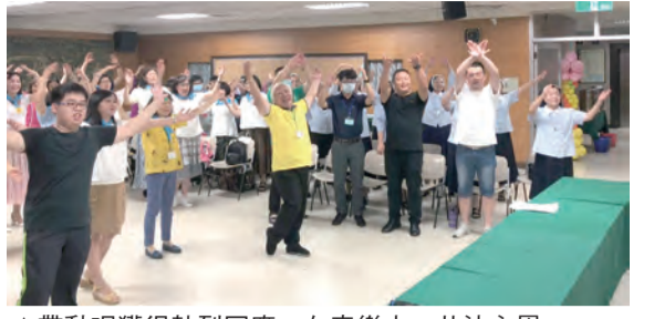
▲帶動唱獲得熱烈回應，在音樂中，共沐主恩。