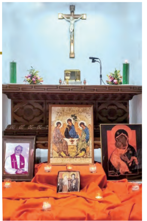
▲每年感恩彌撒搭配雷神父喜歡的泰澤祈禱

雷神父更是海內外知名的漢學家，長年埋首書堆，編撰漢法大字典，並在進行甲骨文研究時，廣交學友，一起探索中國先人智慧及祖先與天主結緣的線索；他透過牧靈福傳、編撰《利氏漢法大字典》、推廣西洋藝術史，以及彙集甲骨文研究等事工，不僅為基督信仰進入