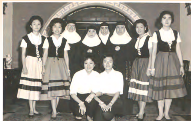
▲總會長來訪，與表演的女青年們合影。