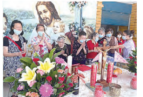
▲禮儀結束，住民長輩們紛紛至祭台前，雙手合十虔誠地默禱。

置。藉由陳神父的講道，不僅增進在場同仁們對教會信仰的了解，也為住民長輩們所關心的生命議題，給予解惑、安定心靈。